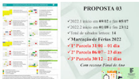
PROPOSTA 03.jpg 227K